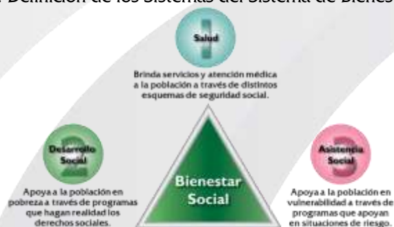
Figura 2. Definición de los Sistemas del Sistema de Bienestar Social.

Conforme a los criterios de CEPAL, la Protección Social consiste en la gama de medidas públicas destinadas a apoyar a los miembros más pobres y vulnerables de una sociedad, así como ayudar a individuos, familias y comunidades a manejar mejor los riesgos, el Sistema de Protección Social incluye programas de seguridad social, tales como pensiones y seguro de salud; así como programas de Asistencia Social (programas de empleos de emergencia y asistencia a los indigentes y transferencias de efectivo, entre otros) y programas y políticas del mercado laboral orientados a la inclusión social y mejora del ingreso económico. El trabajo coordinado de los tres sistemas, garantizará el Bienestar de la Población, al ser responsables de eliminar los rezagos, brechas y condiciones de vulnerabilidad de la población. Por separado cada uno cumple con propósitos específicos: