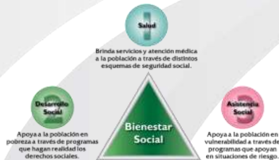
Figura 2. Definición de los Sistemas del Sistema de Bienestar Social.

Conforme a los criterios de CEPAL, la Protección Social consiste en la gama de medidas públicas destinadas a apoyar a los miembros más pobres y vulnerables de una sociedad, así como ayudar a individuos, familias y comunidades a manejar mejor los riesgos, el Sistema de Protección Social incluye programas de seguridad social, tales como pensiones y seguro de salud; así como programas de Asistencia Social (programas de empleos de emergencia y asistencia a los indigentes y transferencias de efectivo, entre otros) y programas y políticas del mercado laboral orientados a la inclusión social y mejora del ingreso económico. El trabajo coordinado de los tres sistemas, garantizará el Bienestar de la Población, al ser responsables de eliminar los rezagos, brechas y condiciones de vulnerabilidad de la población. Por separado cada uno cumple con propósitos específicos: