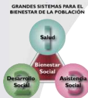
Figura 1. Sistema de Bienestar Social.

La Protección Social se refleja siempre en el grado de Bienestar Social de la población en función de sus carencias y vulnerabilidad. Para garantizarlo, el Estado dispone de 3 sistemas: